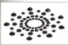
Cubre senos en Rhinestone